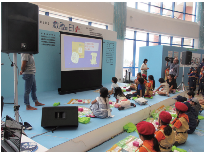
子供たちによる心肺蘇生法講習の様子(平成27年)