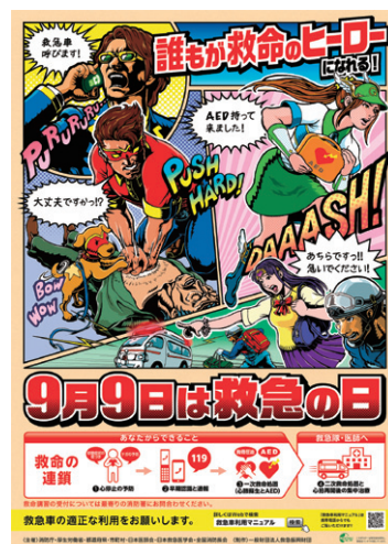
「救急の日」ポスター

1日救急隊長の任命などを通じ、広く救急医療及び救急業務に関心を高めます。また、救急医療及び救急業務関係者の意見交換を行うほか、都道府県又は市町村の実情に応じて、集団事故対策の一環として総合訓練等を実施します。