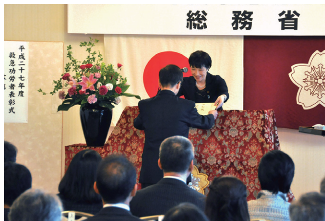
平成27年度救急功労者表彰

毎年9月9日の「救急の日」に合わせて、救急業務の推進に貢献があった個人・団体に対し、総務大臣と消防庁長官が表彰を行います。