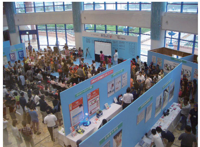
「救急の日」全体風景(平成27年)

今年も全国各地で種々の行事が行われますが、これらの機会を通じて応急手当の重要性が国民の皆様にも再認識され、救急業務に対する理解が深められますよう、また、救急需要対策の一環として「救急車の適正な利用」について各種広報媒体を有効に活用し、救急車の利用状況を始め、救急業務の実態を正確に情報提供することにより、国民の皆様にも「救急車の適正な利用」に対する御理解と御協力が得られることを期待しています。